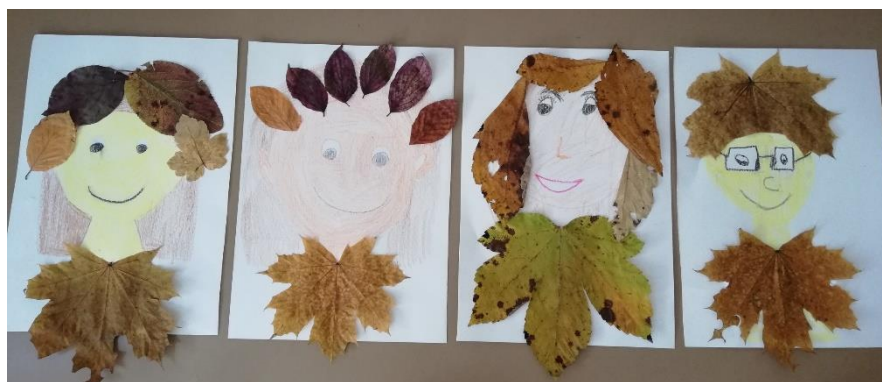
Naši portreti ...