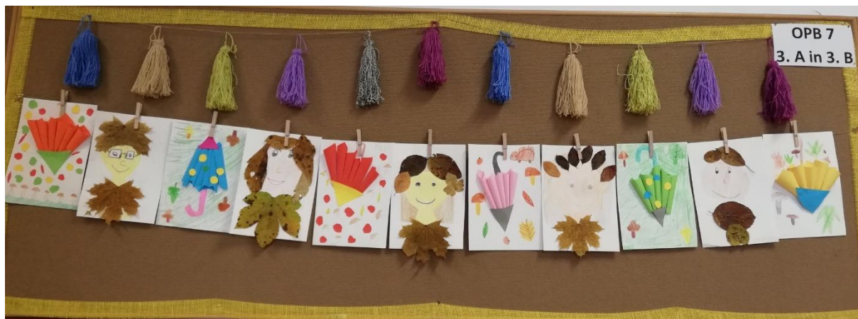
učenci 7. skupine podaljšanega bivanja z učiteljico Laro Henigman